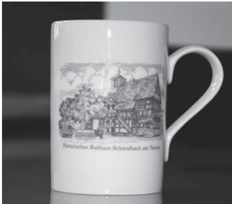
Mit Schwalbach-Flair. Diese weißen Porzellانتassen, versehen mit einer Zeichnung des historischen Rathauses in Alt-Schwalbach gibt es jetzt im Bürgerbüro zu kaufen. Die Tassen sind aus Höchster Porzellan und kosten 19,80 Euro pro Stück. Insgesamt sind noch rund 200 Exemplare vorhanden.