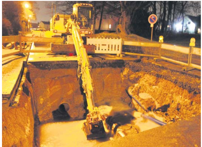
In einem armdicken Strahl schoss das Wasser aus der gebohrten blauen Leitung in die Baugrube an der Einfahrt zur Bahnstraße. In der Folge waren große Teile von Alt-Schwalbach ohne Wasser.

Die CDU habe versucht, die Schwalbacher mit Themen zu überzeugen, während die SPD allein auf die Person von Christiane Augsburg gesetzt habe. Es sei leider nicht gelungen,