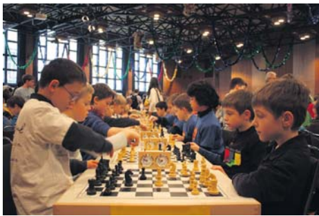
Mit voller Konzentration spielten die Schwalbacher Grundschüler beim Schachturnier in Bornheim.

Schwalbacher beim Frankfurter Schulschachturnier erfolgreich