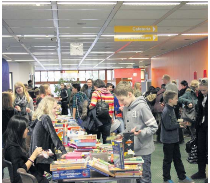
Spenden-Basar. Wie in jedem Jahr veranstalteten die Schüler der Albert-Einstein-Schule am vergangenen Freitag im Rahmen des Elternsprechtages einen Spendenbasar. In der Aula verkauften sie Spiele, Bücher und CD für den guten Zweck, der Förderverein steuerte ein üppiges Kuchen-Buffet bei. Der Erlös geht in diesem Jahr an den Schwalbacher Verein „Kindertaler“.

Am Mittwoch, 5. März, findet das Heringessen am 18. Uhr im Vereinshaus der Anlage Grumbach statt. Anmeldungen werden bis zum 24. Februar unter den Telefonnummern 5241827 oder 85267 entgegen genommen. red